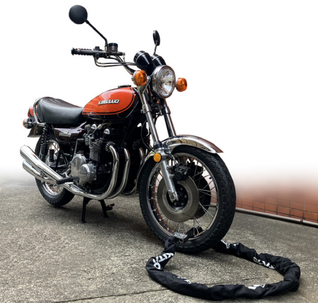
Z-1 900 スーパー 4