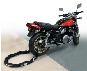
ゼファー 1100 (ZRT10A)